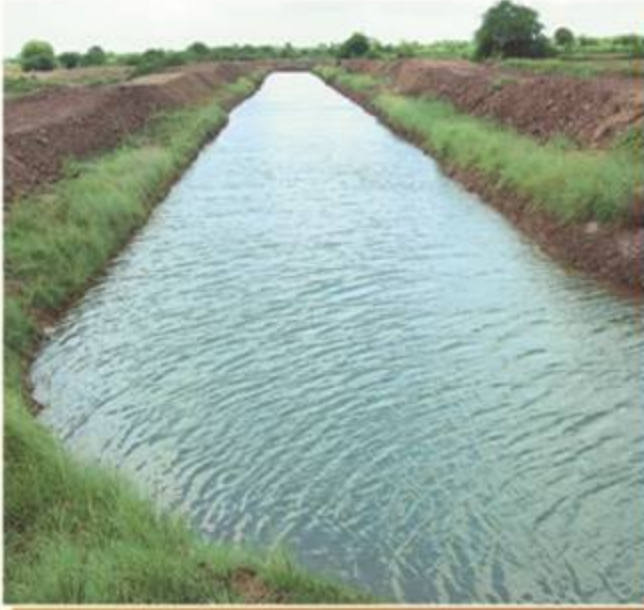
ખીરી - હડીયાણા બંધારા પિસ્તરણ નહેર તા. જોડીયા જી. જામનગર

લાભિત પિસ્તાર : ૯૬૦ હેક્ટર લંબાઈ : ૬.૯૦ લાભિત ગામની સંખ્યા : ૩