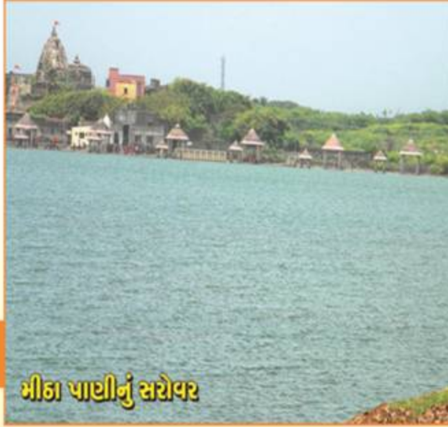
મીઠા પાણીનું સરોવર