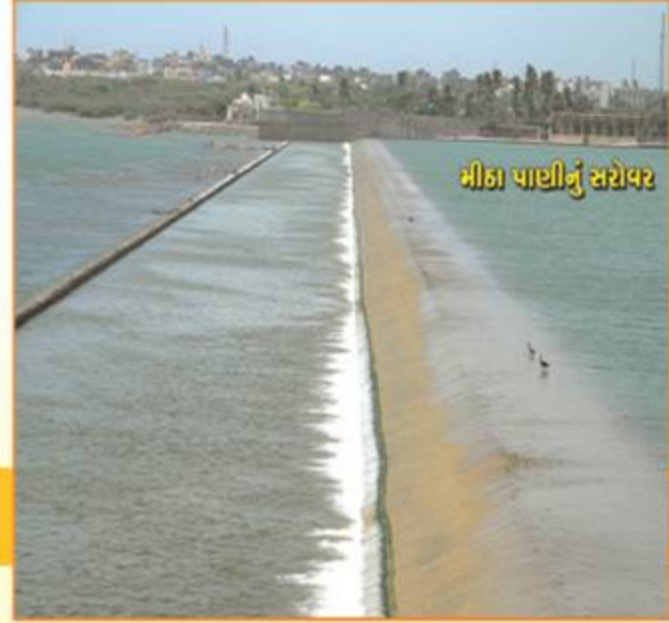
મીઠા પાણીનું સરોવર